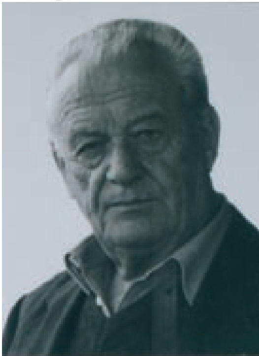
L'immagine al poster, la memoria nei nostri cuori.